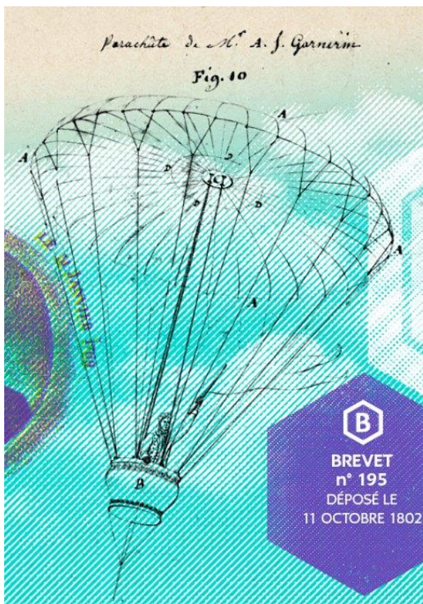
Illustration reproduisant le croquis accompagnant le brevet n°195 du parachute de Garnerin déposé le 11 octobre 1802.

© Crédit illustration : Agence Secrète (pour l'INPI)